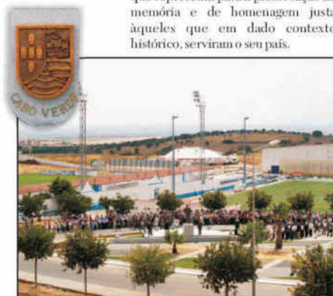
Um grupo de ex-Fuzileiros, combatentes em África, esteve na inauguração do Monumento entre largas centenas de pessoas presentes