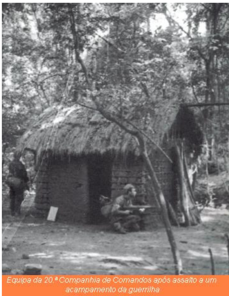
Equipa da 20.ª Companhia de Comandos após assalto a um acampamento da guerrilha

"De referir os magros resultados na captura de material. Efectivamente, de início, a fase em que poderia ter sido capturado, as razões já expostas, resultado da falta de informações concretas e a surpresa que se perdeu, levou a que a captura passasse a ser extraordinariamente difícil, dado que o IN passou a furtar-se a qualquer contacto, e se o tentou foi muito distante, em mata fechada, sem hipótese de ser empreendida uma eficaz perseguição. cremos que a avaliação de resultados à custa do que se apreende em material de guerra nem sempre representa o procedimento mais adequado, dado que quem alimenta a subversão tem-no em quantidade para o fornecer, e disso é exemplo o crescente aumento, quer qualitativo quer quantitativo, que se vem a verificar desde 1961. cremos como mais razoável a destruição do IN, ou da sua vontade de combater,