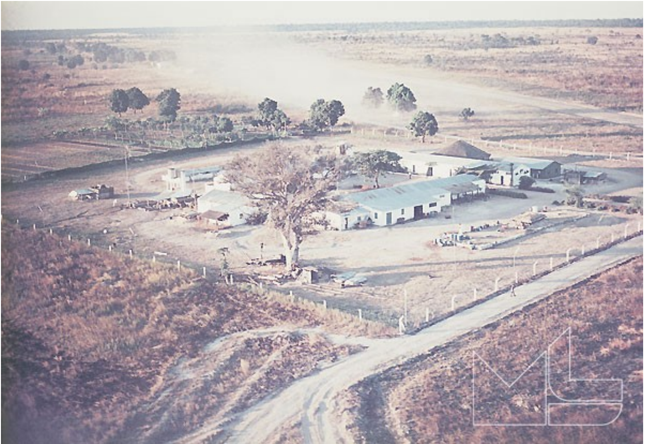
em cima, vista aérea do aquartelamento do Chilombo, junto ao rio Zambeze em baixo, a perspectiva do aquartelamento, da margem oposta do rio