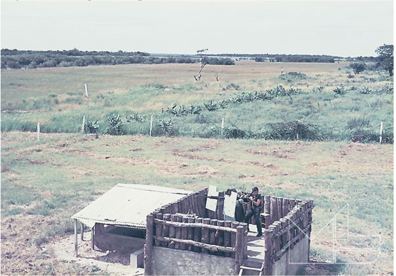
em cima, um posto de observação guarnecido com metralhadora Oerlinkon, de 20 mm em baixo podem observar-se os tejadilhos das cabines das viaturas Mercedes, retirados para minorar o efeito das minas

Em 2 de Junho de 1973, após a formatura de serviço, foram preparadas duas viaturas, uma Mercedes e um Unimog, para seguir para a Lumbala, com uma escolta de uma secção comandada por um sargento.