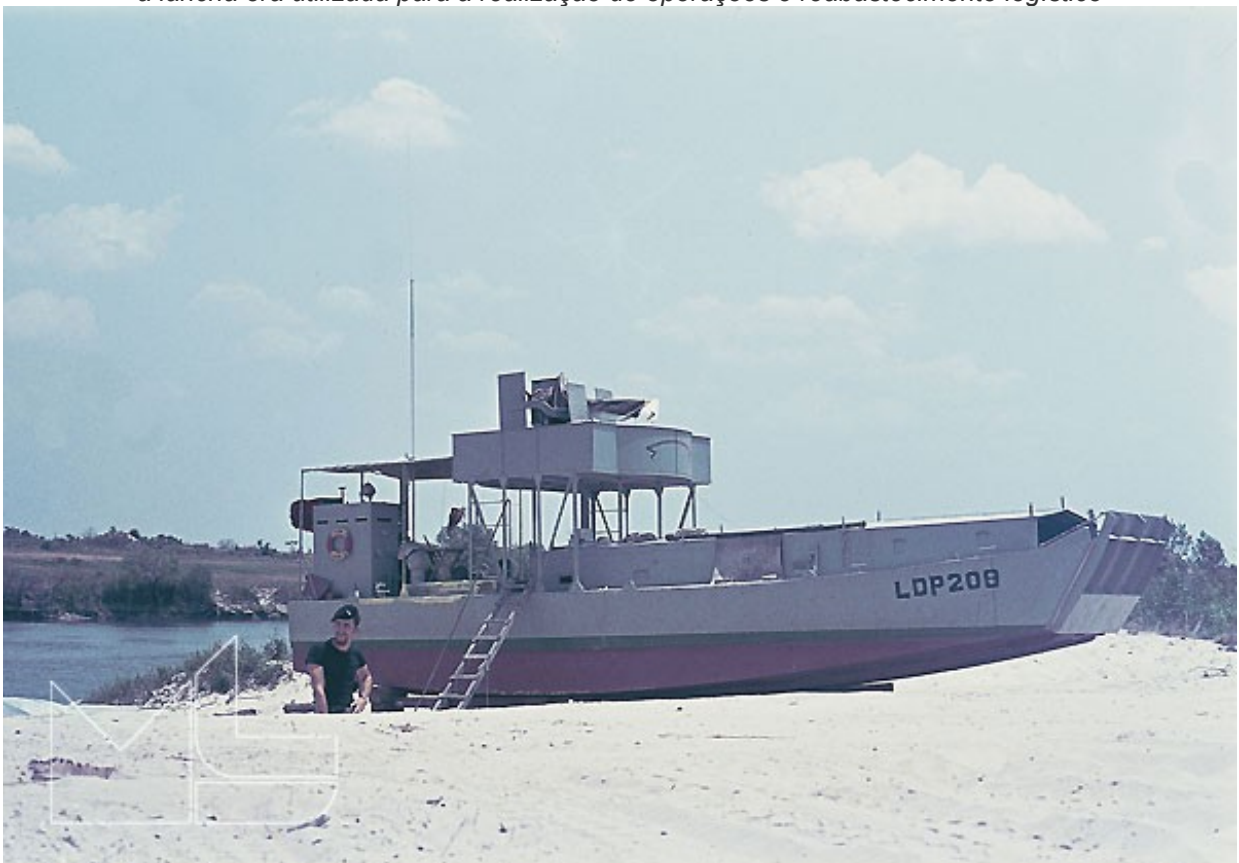
em baixo, a LDP 208 varada na margem do rio, junto ao aquartelamento, durante a estação seca: a lanca era utilizada para a realização de operações e reabastecimento logístico