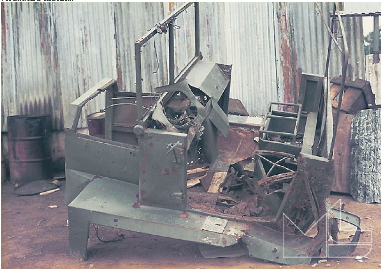
Cabina da viatura emboscada, sendo visíveis os efeitos dos impactos dos tiros e, do lado esquerdo, os danos provocados pelo armamento inimigo.

As bermas da picada, na “zona da morte” foram armadilhadas com cargas de trotil – foram retirados 23 kgs. – a serem accionadas por detonadores eléctricos. Por motivos que se desconhecem, provavelmente retirada precipitada, os detonadores não foram accionados à distância, evitando uma verdadeira chacina.