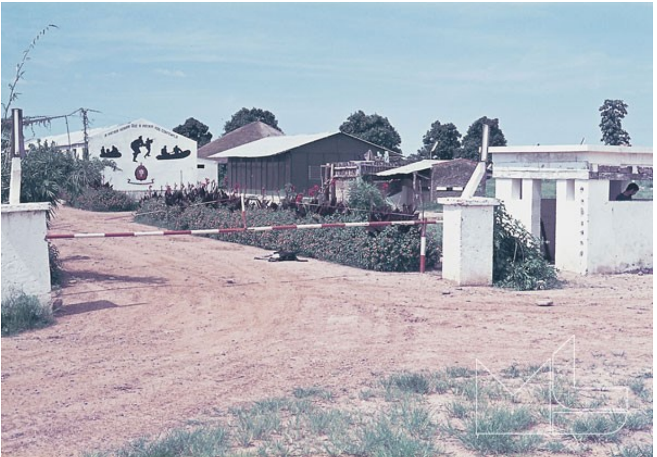
Porta de Armas do aquartelamento do Chilombo

À saída do aquartelamento, foram prestadas honras militares por toda a guarnição da unidade, profundamente abalada com o sucedido, numa última homenagem aos camaradas falecidos e que, de maneira tão trágica, perderam a vida ao serviço da Marinha e da Pátria. A morte daqueles camaradas e a convivência da população, deixaram marcas profundas que dificilmente se apagarão da memória de quantos ali viveram ou prestaram serviço.