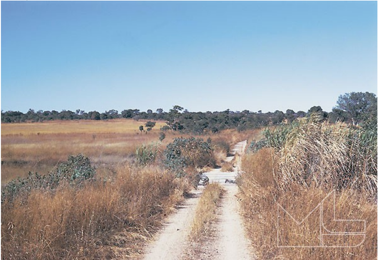
em cima, a Picada do Chilombo para Lumbala

A regularidade da coluna tinha por objectivo levar e trazer o correio, de e para a unidade, aproveitando para o efeito um táxi aéreo fretado pela JATA que, todos os Sábados, escalava Lumbala.