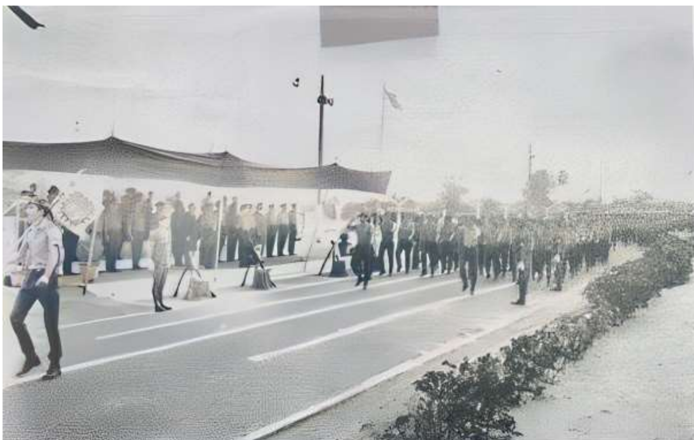
O « ÁS de espadas », desfilando perante a tribuna, após lhe ter sido conferida a alta distinção.

No final, o « ÁS DE ESPADAS », desfilou garbosamente em continência, encerrando-se a cerimónia.