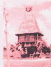
Casa Lulik (Timor)