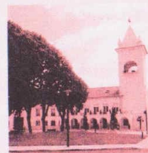
Paços do Concelho (Câmara Municipal de Alcanena)