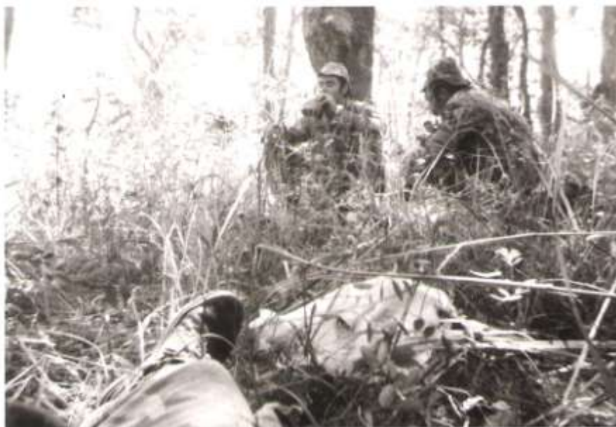
Hora de almoço

No dia 9 a Cart atravessou o rio Lugenda, iniciando batidas na região.