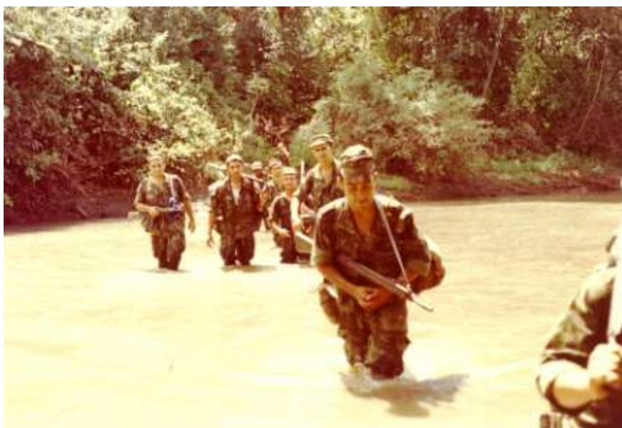
Atravessando um rio

No dia seguinte iniciam a montagem de emboscadas e patrulhamentos sem terem tido contacto com grupos IN.