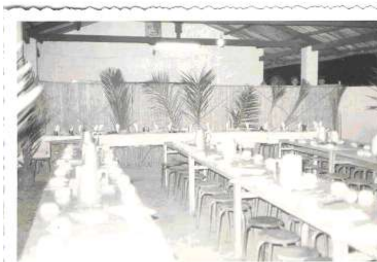
Preparando o Natal de 71

Esta festa de Natal teve o condão de unir e cimentar a amizade que até então reinava entre todos os militares, sem excepções. Foi “inventado” um extraordinário espectáculo musical, só possível graças á criatividade de alguns militares.