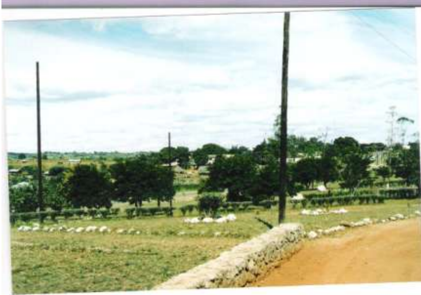
Vila Paiva – centro