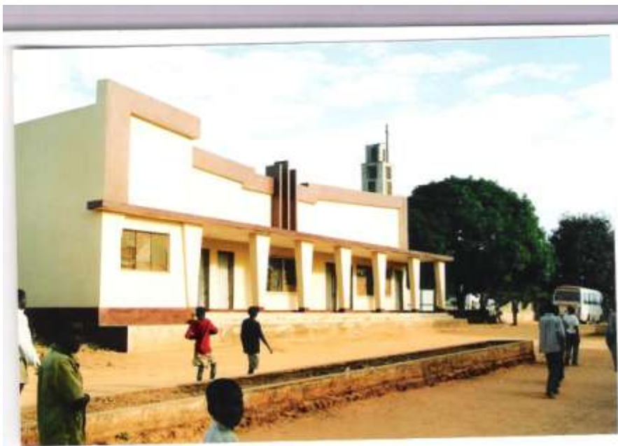
Cantina do Domingos