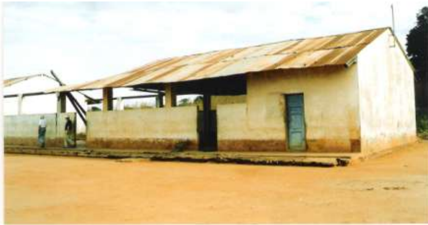
O refeitório de soldados