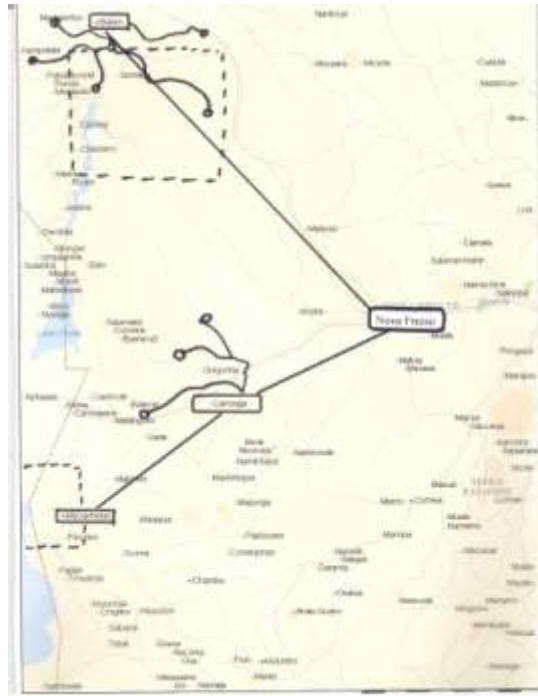
Zona de acção 3