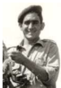
Sold. Cond. Pereira