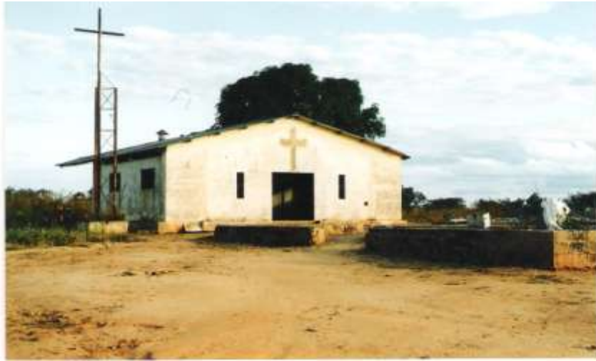
Capela do Batalhão