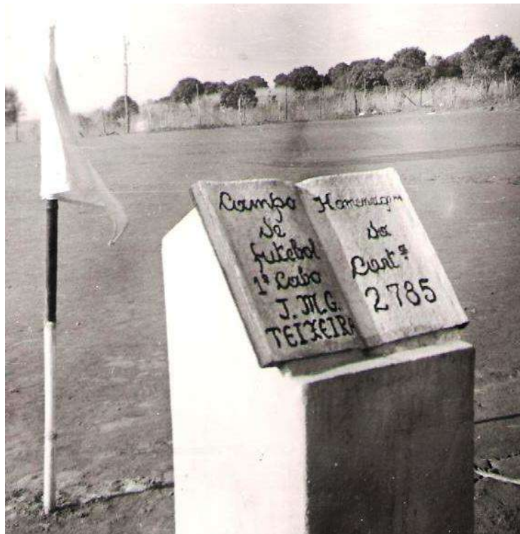
Campo de futebol

1º Grupo de Combate 3, --- 4º Grupo de Combate 2; Form. Comando 5 ----- 2º Grupo de Combate 0; 1º Grupo de Combate 2 ----- 3º Grupo de Combate 0