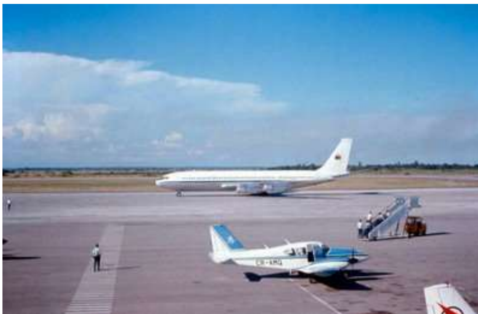
Avião de regresso

No dia 19 de Janeiro de 1973, a Companhia de Artilharia 2785, regressou a Lisboa a bordo de um avião Boeing 707 da Força Aérea Portuguesa, terminando desse modo a aventura em terras de Moçambique.