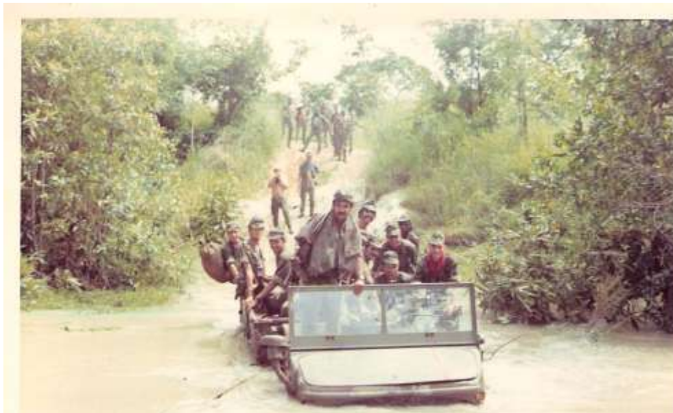
Superando mais um obstáculo

A 4 de Setembro os 3 GC saíram do Muoco pelas 05,00H em direcção ao Murama onde chegam cerca das 18,30H, tendo montado a BT.