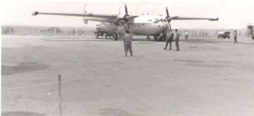
Avião Nordatlas em Marrupa

A Cart iniciou os preparativos para a sua próxima rotação.