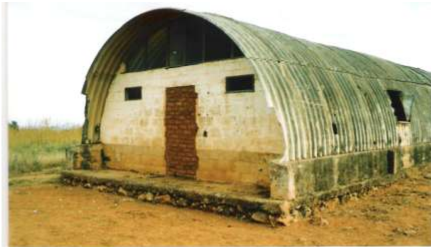
Instalações dos furriéis