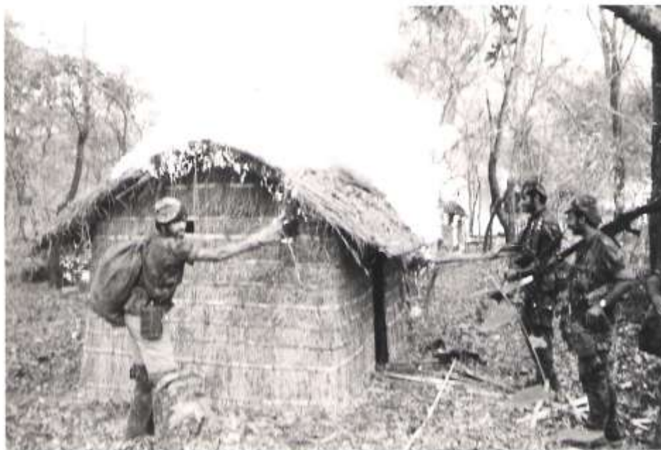
Queimando palhotas no Micuinha

o local um aparelho T6 que depois de localizar a Cart procedeu a intenso bombardeamento de toda a zona. Os 4 GC iniciaram o regresso á BT do Murama, tendo alcançado este aquartelamento no dia 3º de Outubro pelas 16,00H.