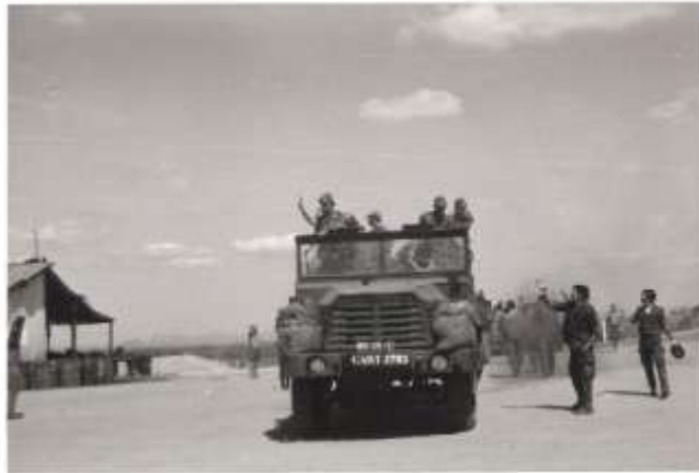
Partida para mais uma operação

O regresso á sede de Marrupa foi feito no dia 1 de Março.