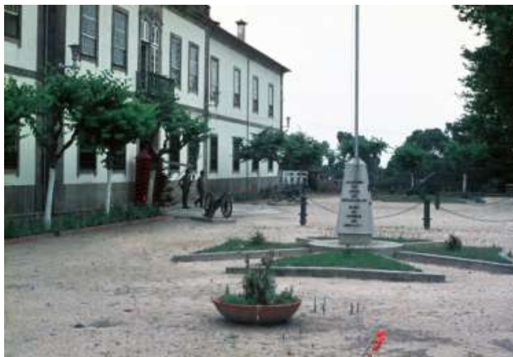
RAL 5 Penafiel

A Cart. 2785 deslocou-se de comboio para Lisboa no dia 21 de Novembro, onde embarcou para a Região Militar de Moçambique nesse mesmo dia a bordo do navio “NIASSA”