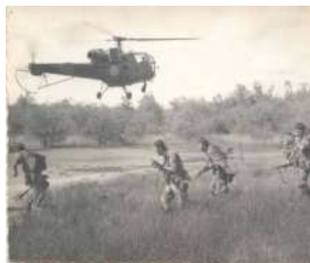
Saltando no Micuinha