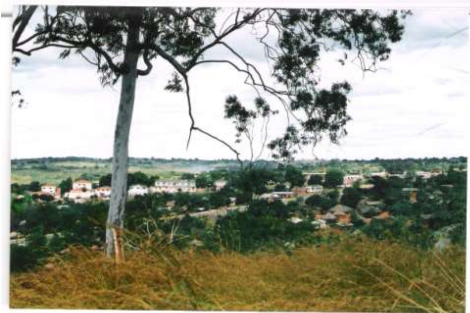
Vila Paiva vista do antigo Quartel