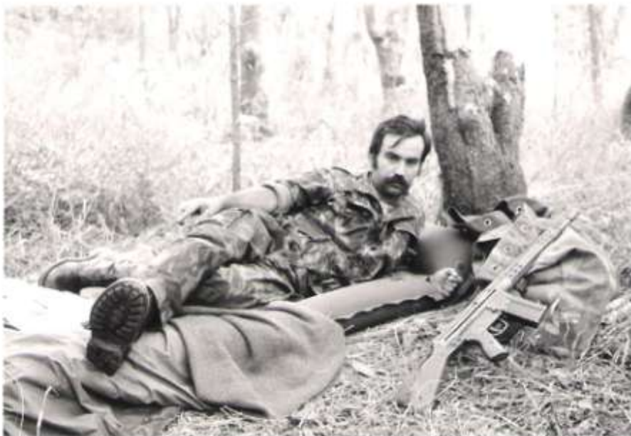
Hora de dormir

Nos dias 16 e 17 mantiveram-se em acções de patrulha e nomadização.