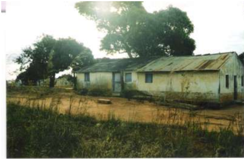
Casa da guarda e caserna de condutores