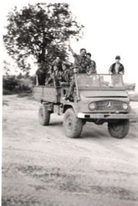
A alegria do regresso

Esta operação decorreu até ao dia 17, tendo regressado nesse dia a Marrupa.