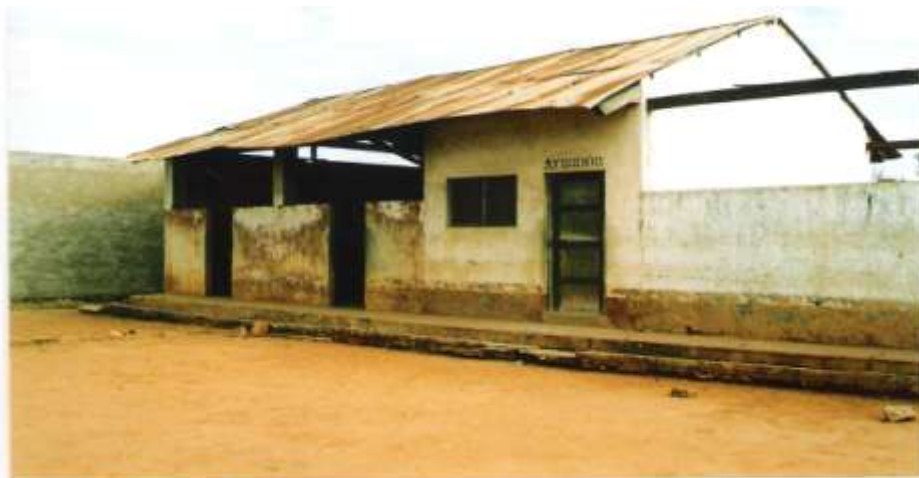
Cozinha e depósito de géneros