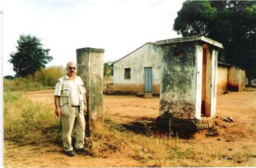
O autor junto à porta de armas