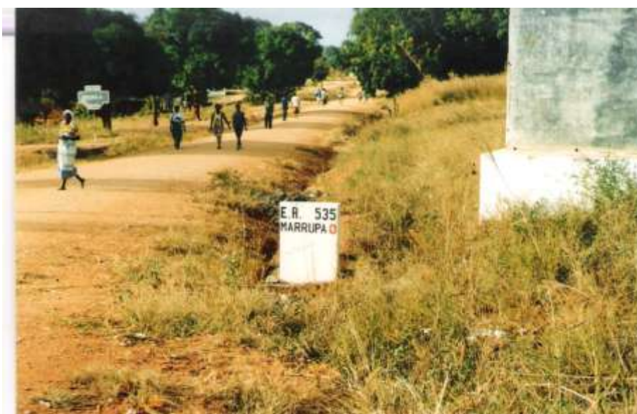
Picada para o aldeamento