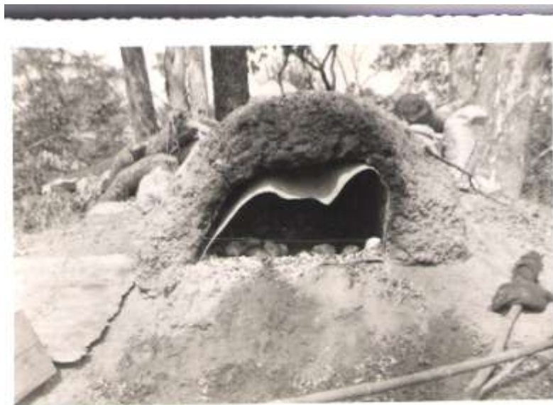
Forno construído em morro de formiga na base América

No dia 16 procedeu á montagem da BT (Base Temporária), procedendo-se ao trabalho da montagem das cozinhas, forno para fabrico de pão (aproveitou-se para este efeito um morro de formiga ), abrigos, instalação de morteiro e outros esquemas defensivos.