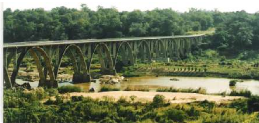
Ponte sobre o rio Pungué

Durante os dias que passámos fazendo a segurança á construção da nova ponte tivemos oportunidade de confraternizar com o pessoal deslocado naquele local, operários e técnicos. Foi ali que certa noite fomos presenteados com um caldo verde soberbo, feito da maneira mais genuíno como se estivéssemos em qualquer aldeia portuguesa. A ponte estava praticamente no seu inicio mas já deixava perceber que seria uma obra muito bem desenhada e ficaria num local de rara beleza. Assim, foi com grande emoção que passados cerca de 34 anos atravessei aquela obra de arte.