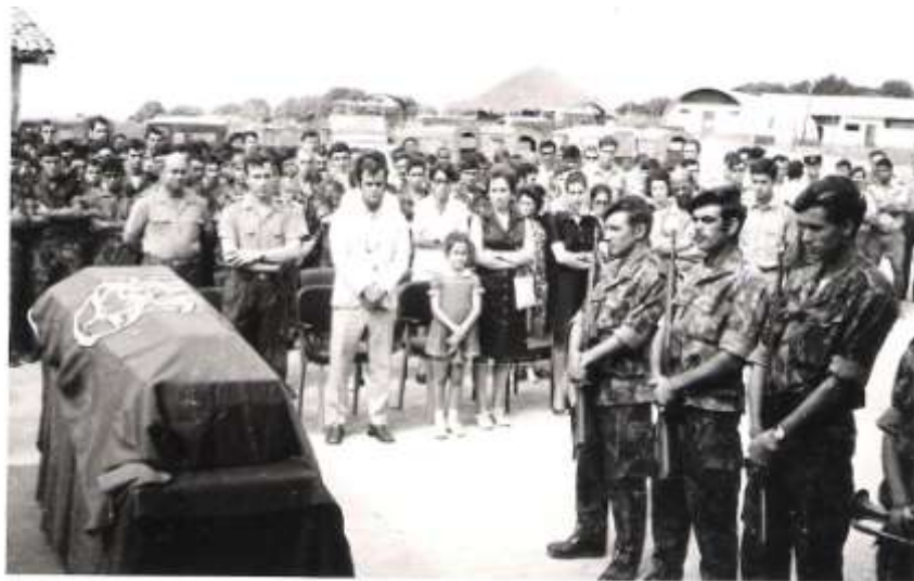
O adeus ao Pereira