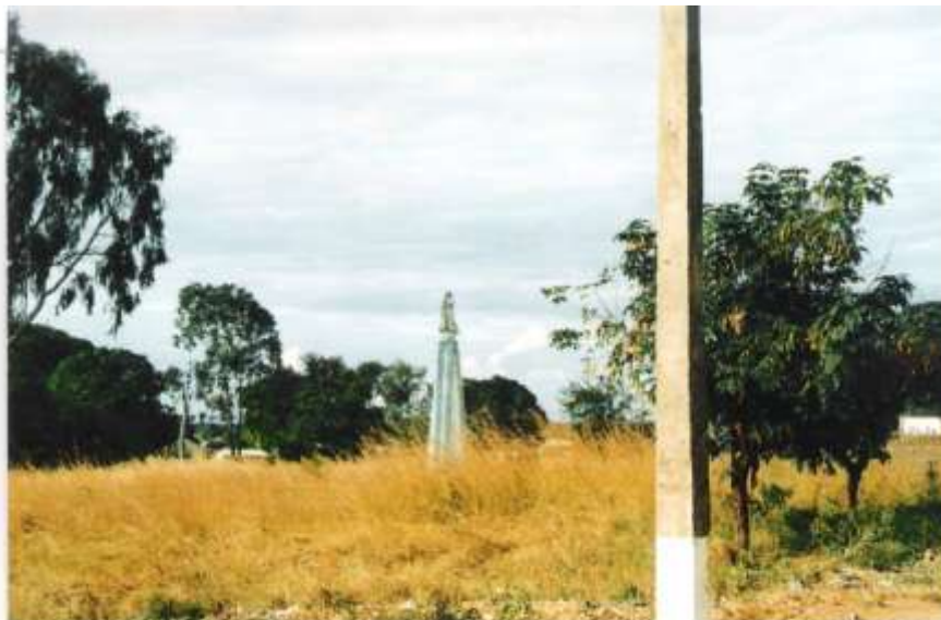
Imagem de Nossa Senhora