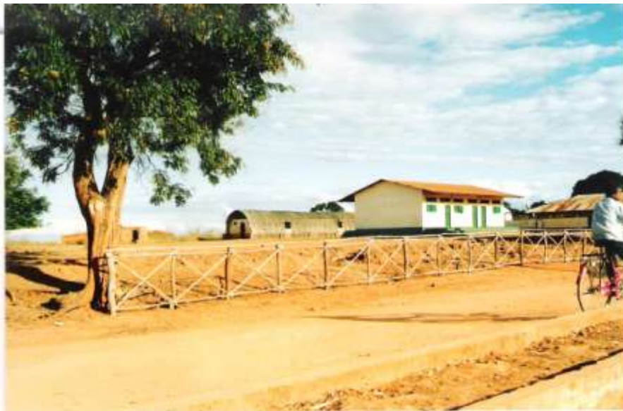
Instalações do STM