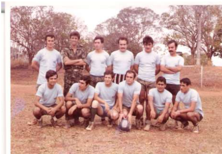
Equipa da Cart em Vila Paiva

Durante a permanência em Vila Paiva igualmente foram realizados 2 desafios de futebol que opôs uma “selecção” da Cart a um grupo dos trabalhadores que construía a nova ponte sobre o rio Pungué.