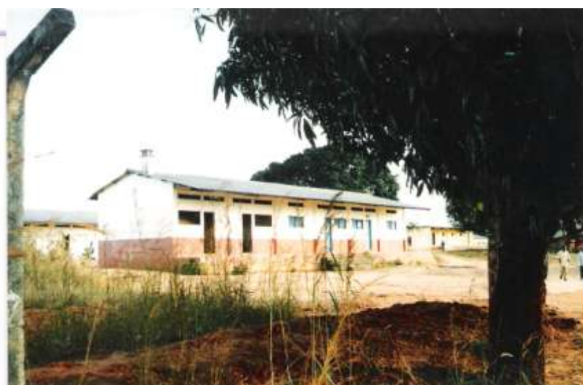
Parte das instalações do Batalhão