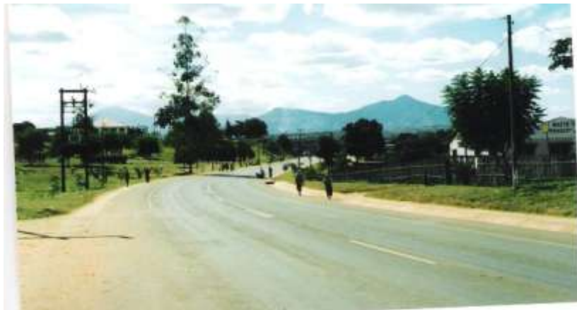
Vila Paiva – Serra da Gorongosa ao fundo